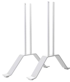
Zubehör: Standfüße VZ-VF-SF