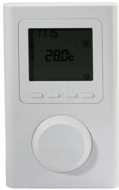
Notwendiges Zubehör: Raumthermostat VTX-SP