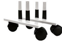
Zubehör: Laufrollen VZ-VF-LR