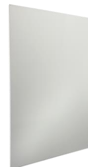
VL-Axxxxx in Weiß