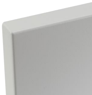
Detail von der Ecke