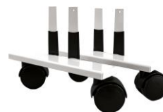
Zubehör: Laufrollen VZ-VF-LR