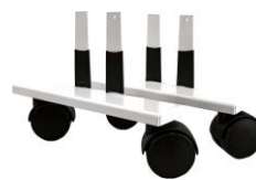
Zubehör: Laufrollen VZ-VF-LR