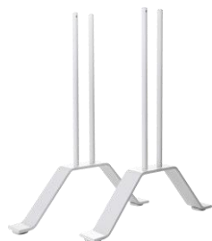
Zubehör: Standfüße VZ-VF-SF